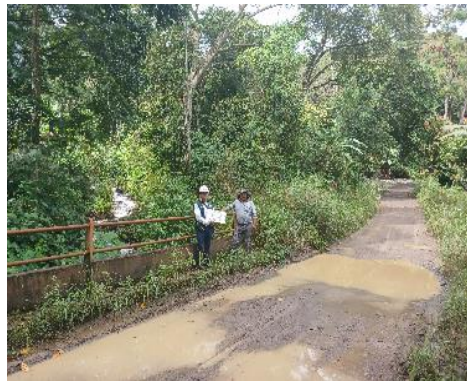
FOTO N°03: SE MUESTRA EL CAUCE DE LA QUEBRADA COCHAYOC COLMATADO, SE REQUIERE LIMPIEZA Y DESCOLMATACIÓN.