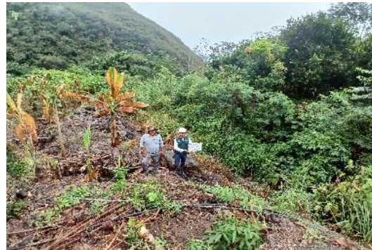
FOTO N°01 Y N° 02: SE MUESTRA EL CAUCE DE LA QUEBRADA COCHAYOC COLMATADO, SE REQUIERE LIMPIEZA Y DESCOLMATACIÓN.